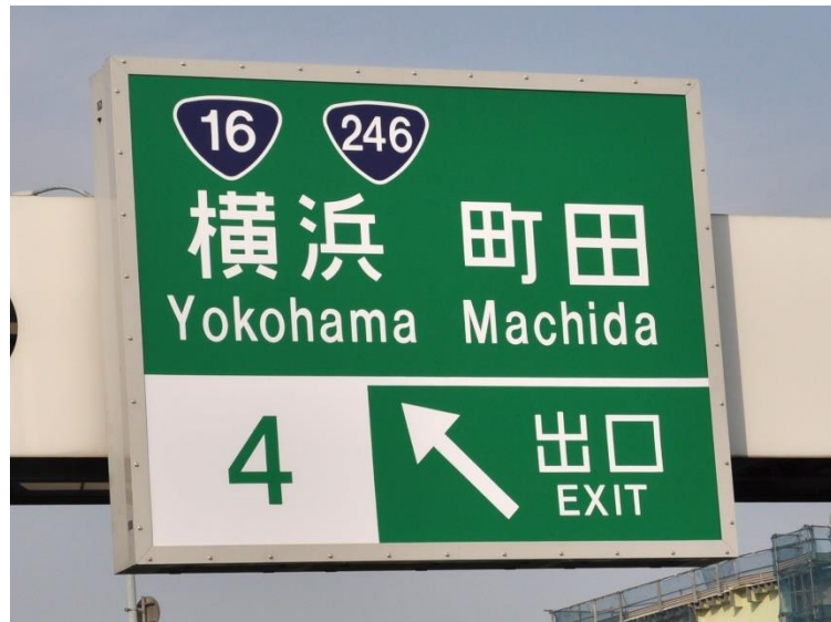
画像出典 Wiki Commons : Exit sign of Yokohama Machida IC ( https://commons.wikimedia.org/wiki/File:Exit_sign_of_Yokohama_Machida_IC.jpg )